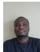
Attivi Ayi Apelette 0477/75.08.59